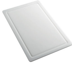
Planche de découpe en HPDE 8657 001