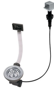
Vidange automatique LIRA 8407 103