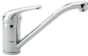
Mitigeur S1000 - RO 8443 002