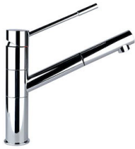
Mitigeur Lorenzo 8466 000