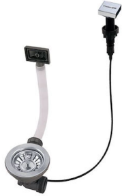
Vidange automatique LIRA 8407 102